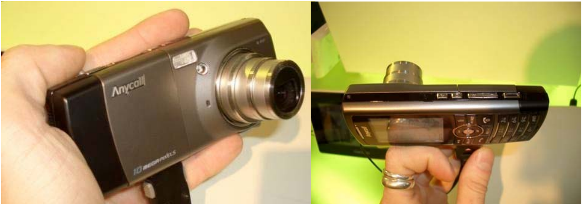
Samsung's SCH-B600 10 megapixel cameraphone

How will camera phones influence journalism?